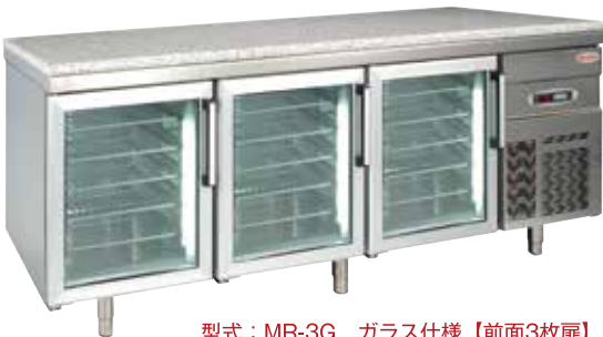
型式：MR-3G ガラス仕様【前面3枚扉】

天板600×400mmが収納できる、作業性抜群なコールドテーブル。 コールドテーブル上の御影石、庫内照明は標準装備。 洗練されたスタイリッシュなデザインはオープンキッチンに最適。 扉の種類はガラス・ステンレスの2タイプ。 扉数は前面2枚・3枚または前後面4枚・6枚の4タイプ。