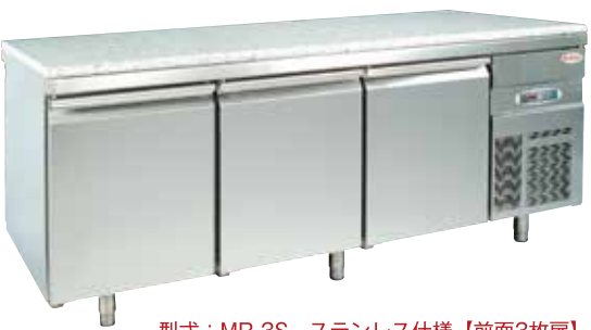
型式：MR-3S ステンレス仕様【前面3枚扉】

※ガラス・ステンレス仕様の外形寸法は同じです。※型式末尾G=ガラス仕様 S=ステンレス仕様